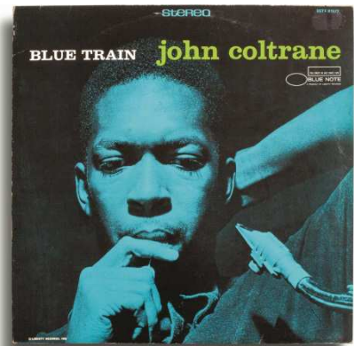
Francis Wolff John Coltrane, Blue Train, 1957 © Blue Note Records

Die Vinylplatte und die analoge Fotografie sind zu medialen Sinnbildern des 20. Jahrhunderts geworden. Der nostalgische Wert einer Schallplatte ist vielfach mindestens ebenso stark an das Coverbild geknüpft wie an die musikalische Aufnahme. Ein Blick auf die gemeinsame Geschichte von Vinyl und Fotografie zeigt ein vielschichtiges Austauschverhältnis, das sich über das Cover des weitverbreitetsten und kommerziell erfolgreichsten Hörformats des 20. Jahrhunderts ablesen lässt. An rund 500 Schallplattencovers beleuchtet Total Records das vielseitige Zusammenspiel zwischen Fotografie und Musik von den 1960er bis in die 2000er Jahre und nimmt uns mit auf eine Reise in die Kultur- und Mediengeschichte des 20. Jahrhunderts – und in unsere jeweils ganz persönlichen, an die Bilder und Musik geknüpften Erinnerungswelten.