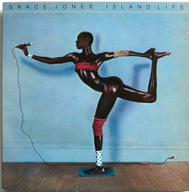
Jean-Paul Goude Grace Jones, Island Life, 1985

27. Februar bis 16. Mai 2016 Fotomuseum Winterthur